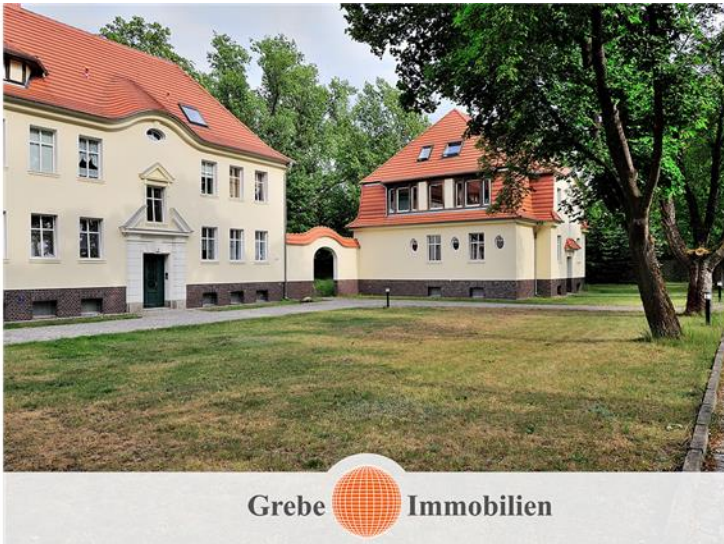
Ahornring 2 im 1. OG rechts