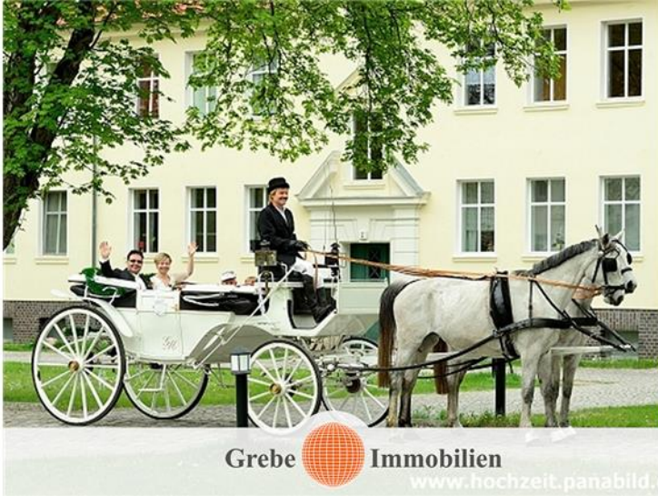
Wohnung Miete Zossen GREBE CONSULT