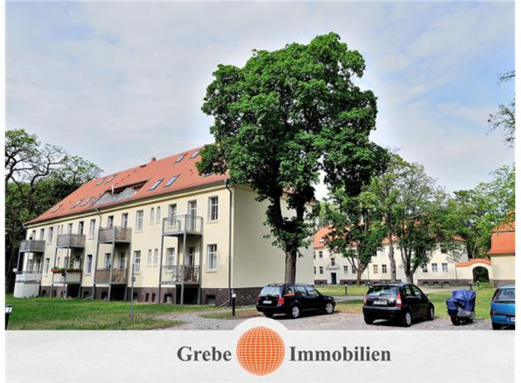
Die Wohnanlage Ahornring